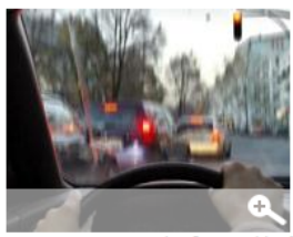
Der ADAC rät zu regelmäßigen Sehkraft-Kontrollen um das Risiko von Unfällen zu verringern.

Das Internetportal www.kfzversicherungen.org bietet den Sehtest für Senioren an, um auf die nachlassende Sehkraft im Alter hinzuweisen. Mit der passenden Brille oder Kontaktlinsen kann die verminderte Leistung der Augen im Alter ausgeglichen oder vermindert werden.